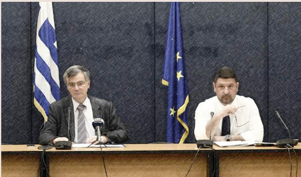
Εκείνες τις ημέρες, κάθε απόγευμα στις 18:00 ο ελληνικός λαός περίμενε πώς και πώς την ενημέρωση για την πορεία της πανδημίας στη χώρα από τον Νίκο Χαρδαλιά και τον Σωτήρη Τσιόδρα.