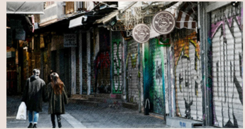
18 Μαρτίου 2020: Πέφτουν τα ρολιά στα εμπορικά καταστήματα ενώ τίθεται σε ισχύ η απαγόρευση συναθροίσεων άνω των 10 ατόμων και τρεις ημέρες αργότερα ανακοινώνεται η απαγόρευση οποιασδήποτε άσκοπης κυκλοφορίας.