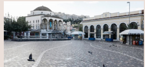
Η Αθήνα άδεια και έρημη εν μέσω πανδημίας. Στις 24 Μαρτίου ο υπουργός Οικονομικών Χρήστος Σταϊκούρας δηλώνει ότι «η κρίση θα γίνει βαθύτερη και η οικονομία θα γυρίσει σε ύφεση το 2020».