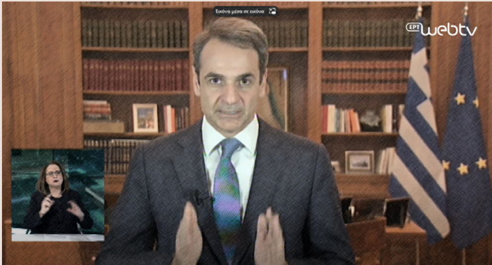
11 Μαρτίου 2020: το πρώτο διάγγελμα του πρωθυπουργού. Ακολούθησαν αρκετά, προς ενημέρωση των πολιτών μιλώντας για έναν «εχθρό αόρατο και ύπουλο».