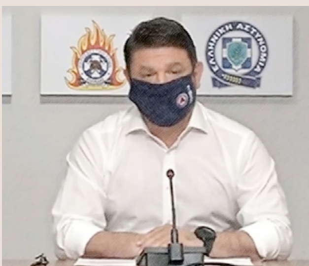
Στις 30 Αυγούστου 2020 ο συνολικός αριθμός των κρουσμάτων στη χώρα από την έναρξη της πανδημίας ξεπέρασε τις 10.000. Ανήμερα των Χριστουγέννων φτάνουν στην Ελλάδα τα πρώτα εμβόλια της Pfizer.